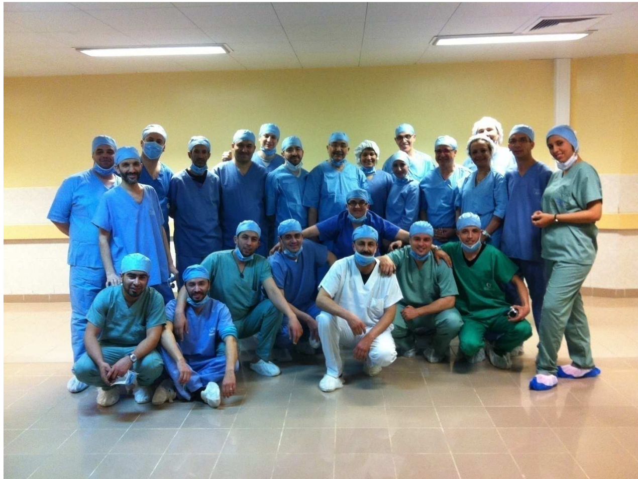
5ème colloque France-Maghreb sur la transplantation d'organes, de tissus et de cellules