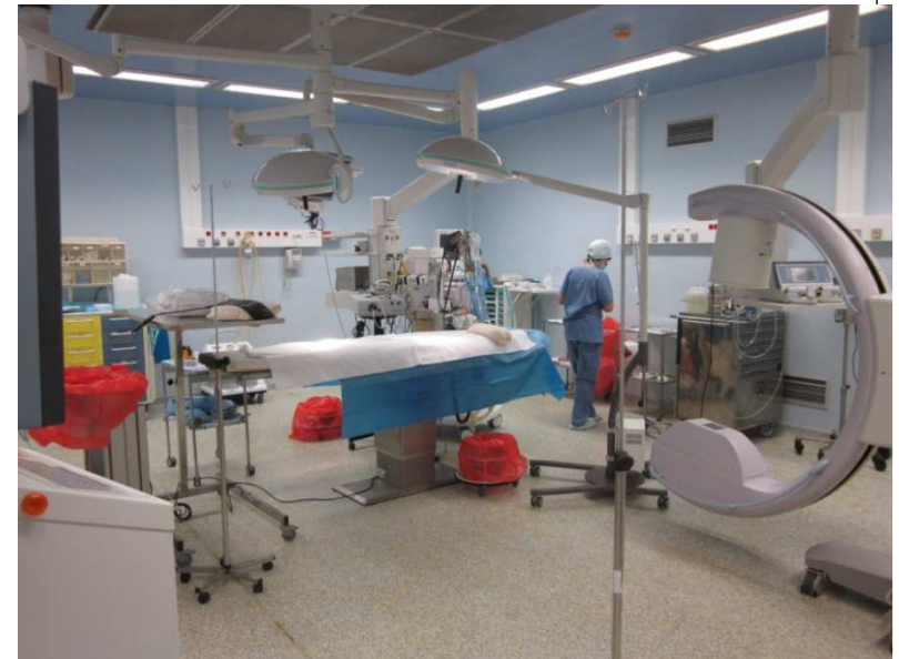
5ème colloque France-Maghreb sur la transplantation d'organes, de tissus et de cellules