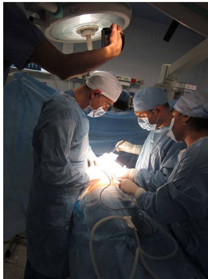
5ème colloque France-Maghreb sur la transplantation d'organes, de tissus et de cellules