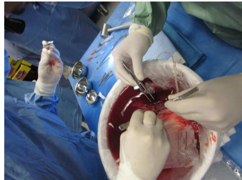
5ème colloque France-Maghreb sur la transplantation d'organes, de tissus et de cellules